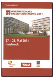
Passivhausinstitut Darmstadt (Hrsg.) 15. Internationale Passivhaustagung 27.–28. Mai 2011 Tagungsband

Die Ähnlichkeiten Lettlands und Österreichs hinsichtlich Klima, Konstruktionsweisen als auch Ge-