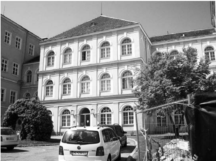
Abb. 2+3: Sanierung des Patrestrakt mit YTONG Multipor Innendämmung.

Das neue Wohnheim des Vereins Gemeinschaft B.R.O.T. – Kalksburg am Promenadeweg 3 in Wien-Liesing verfolgt das Ziel, eine gemeinschaftliche und solidarische Wohnform zu schaffen, die die In-